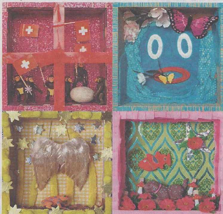
Quatre des 84 boîtes fantaisistes imaginées par Cleide Saito.

Michael Othenin-Girard, le président du festival des arts de la rue organisé à La Chaux-de-Fonds, quittera prochainement ses fonctions.